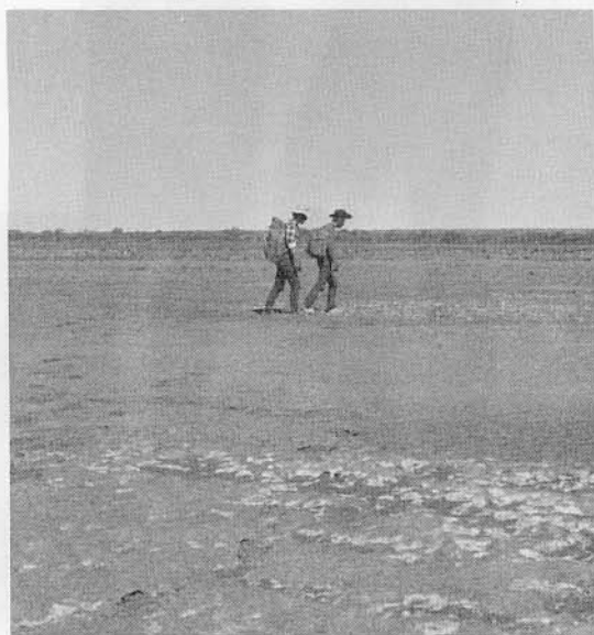
下：地平線の世界を 行く合田・槻谷 両隊員 (塩湖)