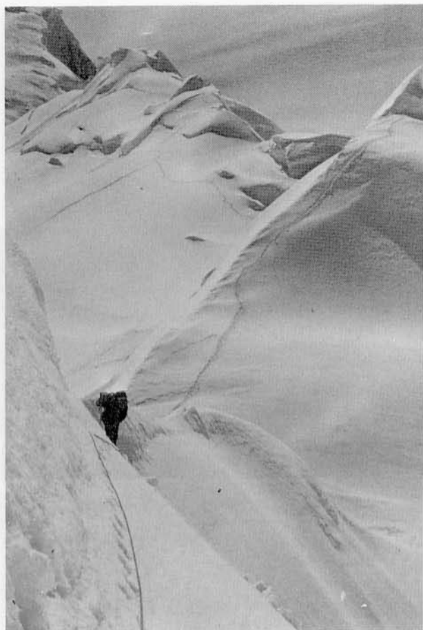
上：アタックキャンプへのトラバース