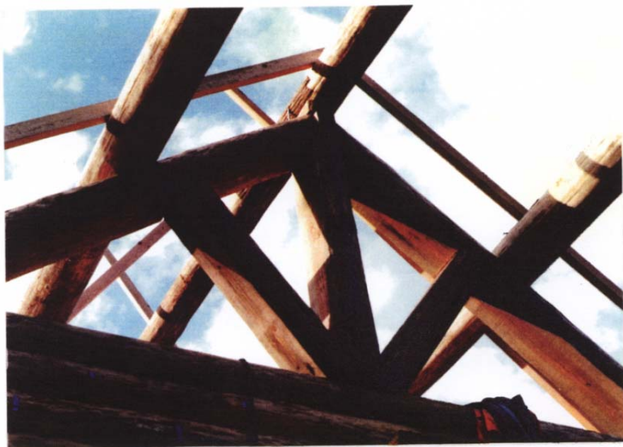
61年11月24日 棟木、母屋のセット