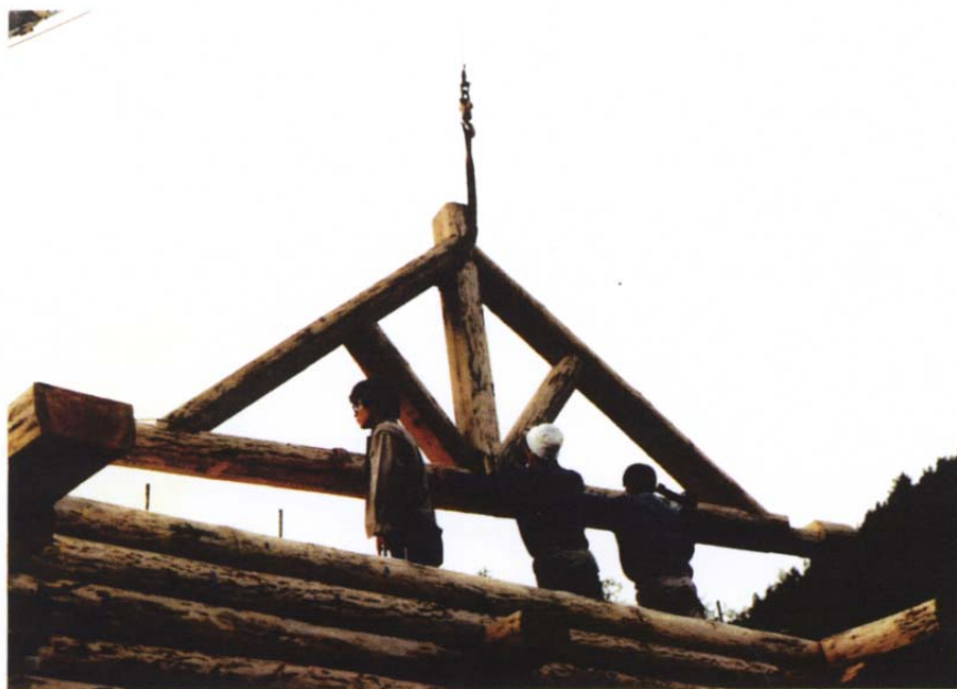
61年11月23日 トラスのセッティング、感動の一瞬